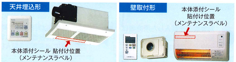
(例)本体添付シール

【特定保守製品】【特定製造事業者等名】パナソニック エコシステムズ株式会社 【問い合わせ先】 パナソニック株式会社 愛知県春日井市鷹來町字下仲田4017番 長期使用製品安全点検センター 0120-841-344