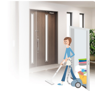
1階から2階の掃除も 部屋を回る手軽さです。

足腰が弱ると2階への移動が たいへん。エレベーターが あれば平屋感覚で洗濯物や 買い物もラクに運べます。 階段での転倒などの危険も 減らせます。