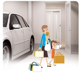
たくさんの買い物も、ガレージから 2階へラクに運べます。