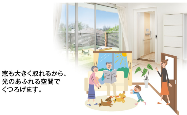
窓も大きく取れるから、 光のあふれる空間で くつろげます。

日当たりや風通しの良い2階はくつろぐのに ふさわしいスペース。集まって食事をしたり、 おしゃべりをして楽しめます。