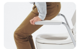
アームレストで立ち座りをサポート。