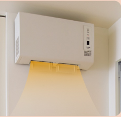
脱衣室暖房乾燥機ならカラッと乾燥。