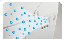
脱臭効果のあるナノイーを退室後、自動で放出。