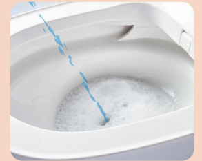
泡のクッションで受け止め、床や壁などへの汚れを抑制。