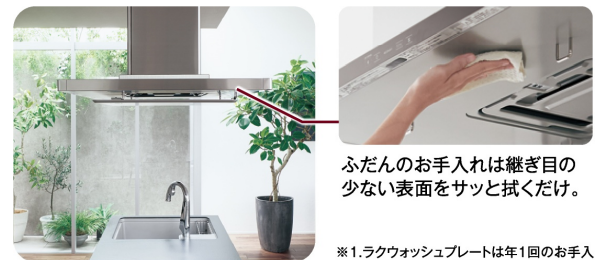
ふだんのお手入れは継ぎ目の 少ない表面をサッと拭くだけ。

レンジフードの下でも会話をさまたげない静けさです。 また、ファンのお手入れは10年間不要。