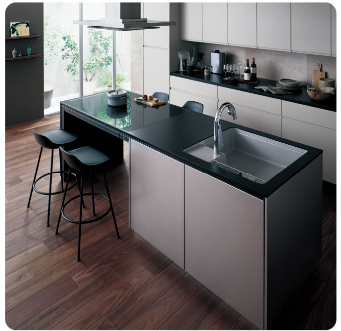
コンロの下がオープンなので椅子を置いてもしゃまになりません。

4つのコンロで同時に 調理ができるので、 煮たり焼いたり、 レパートリーが 広がります。