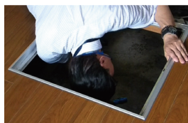
点検しにくい床下や小屋根、水廻りもチェック。