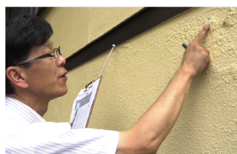
専用器具等を使って、綿密に診断します。