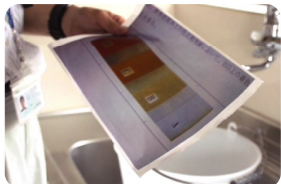
水回りの錆、作動状況をチェック。