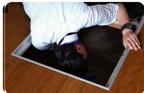
目の届きにくい場所もチェック