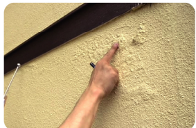
外壁の浮きやハガレをチェック。