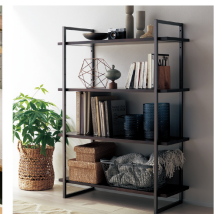
フレームシェルフ