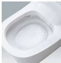
全自動おそうじトイレ