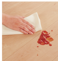
アーキスペックベリテイス