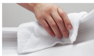
スキマや段差がほとんどないので ふき掃除がラクラク