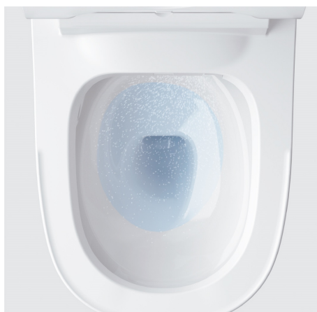
水アカと汚れのつきにくいスコピカ素材で ツルンとキレイなトイレをキープ