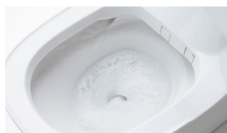
洗剤の泡と勢のある水流で 流すたびに便器内をしっかりおそうじ

いまどきのトイレは自動で洗浄・汚れをガードし、ニオイもスッキリ。毎日おそうじしなくても、清潔感を保ちます。