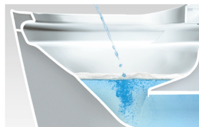
洗剤の泡がクッションになって トビハネを抑えるから床が汚れにくい