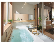
生活リズムが異なっても、時間を気にせず入浴できる