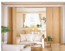
シーンに応じて開け閉めできる間仕切り開閉壁