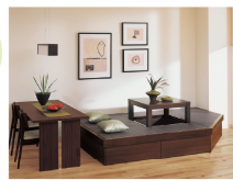
立ち座りが楽な畳が丘を囲らんスペースに