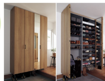
ベビーカーやゴルフバッグも収納できる玄関収納