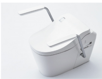
寝室のそばに設置しても流水音が気になりにくいトイレ