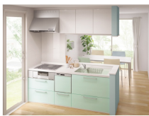
セカンドキッチンにびったりの小さめサイズ