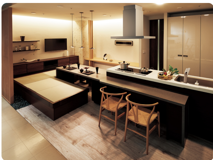
こんなアイランドタイプのキッチンなら、みんなで囲んで作ったりお手伝いもしやすい。ダイニングテーブルを一緒にしたプランなので、その場で作って食べられます。