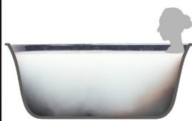
酵素を含んだマイクロの泡が お肌をしっとり(酸素美泡湯®)。