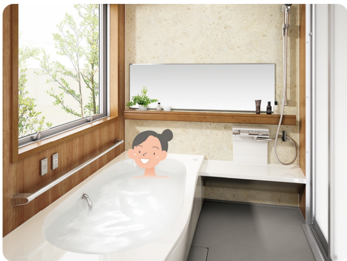
リフォームで、今より幅も奥行も5cm広げることができます。浴槽もワンサイズアップ。